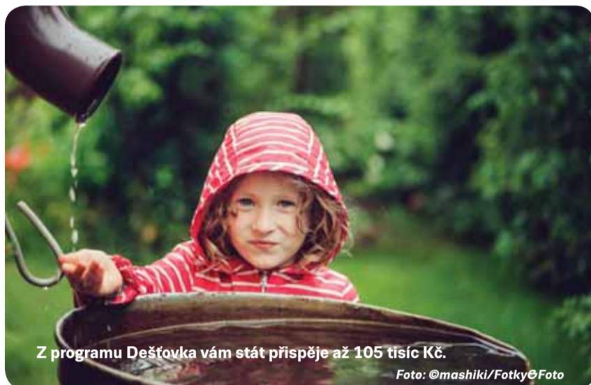
Z programu Dešťovka vám stát přispěje až 105 tisíc Kč.

„Letošní extrémně suchá sezóna ukázala, že nedostatkem vody je postižena v podstatě již celá republika. Celkový roční úhrn srážek sice výrazně neklesá, ale zásadně se mění rozložení srážek v roce, kdy extrémní sucha střídají silné přívalové lijáky. Musíme proto vodu lépe využívat pro různé účely,“ uvádí ministr Richard Brabec. „Proto nabízíme možnost pořídit si dotovanou nádrž k závlivce zahrady všem majitelům obytných domů napříč celou