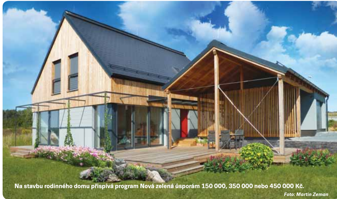
Na stavbu rodinného domu přispívá program Nová zelená úsporám 150 000, 350 000 nebo 450 000 Kč.

Pokud stavíte nebo modernizujete bydlení, můžete požádat o dotaci z programu Nová zelená úsporám.