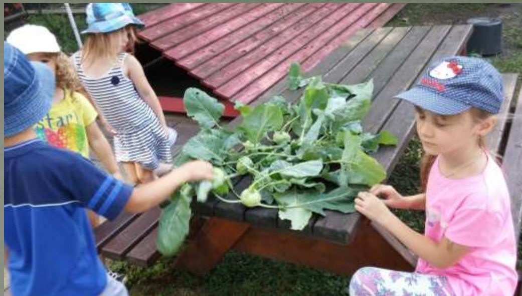
SKLÍZENÍ VÝPĚSTKŮ ZE ZAHRÁDKY